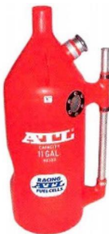
“ATL código: RE103-2” – Imágen a modo ilustrativo

El armado del venteo del botellón de 11 galones deberá respetar las siguientes instrucciones: